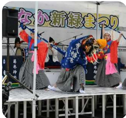
6月 まちなか新緑まつり