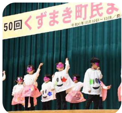
10月 くずまき町民まつり