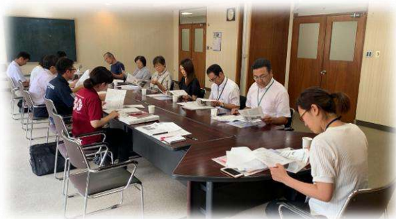
ガイド作成検討の様子

令和元年度、移住交流検討部会（現関係人口創出部会）では、移住者向けにアンケートを実施しました。そのアンケート結果をもとに、葛巻町で生活を始めるみなさんへ先輩移住者の声をお届けします。少しでも参考にさせていただけたら幸いです。