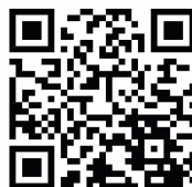
いらっしやい葛巻推進課 X