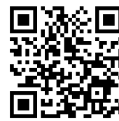
いらっしやい葛巻推進課 Facebook