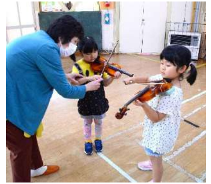
保育園では年長児を対象にバイオリン学習を行っています。

また、町外から葛巻高校の入学生を受け入れる「山村留学」や葛巻高校生が無料で使える「葛巻町学習塾」の運営など、町内唯一の高校である葛巻高校の支援を積極的に行っています。