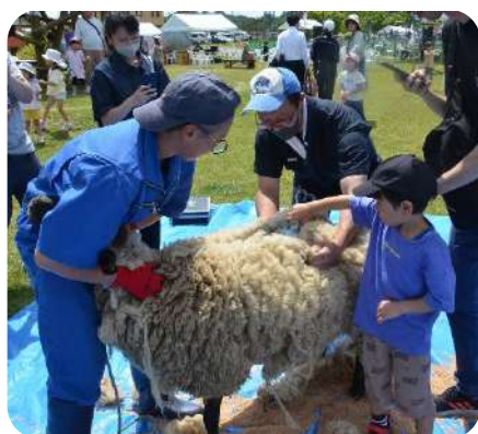
6月 くずまき高原牧場まつり