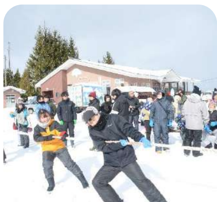
2月 くずまき高原牧場冬まつり