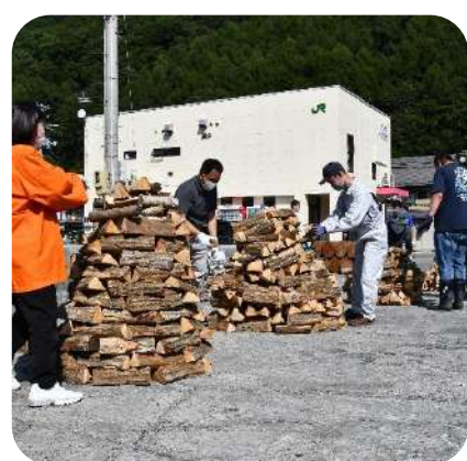
10月 全日本薪積み選手権