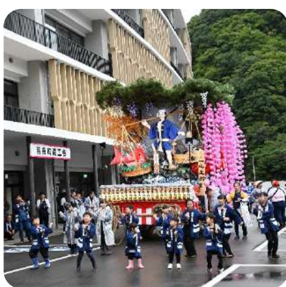
9月 くずまき秋まつり