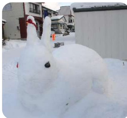
2月 まちなか雪像コンテスト