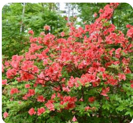
5月 平庭高原つつじまつり

例年行われる町内の主な催しは、くずまきカレンダーにも掲載されていますが、詳しくは、町商工会や役場の観光担当にお問い合わせください。