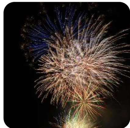
7月 まちなか夏まつり