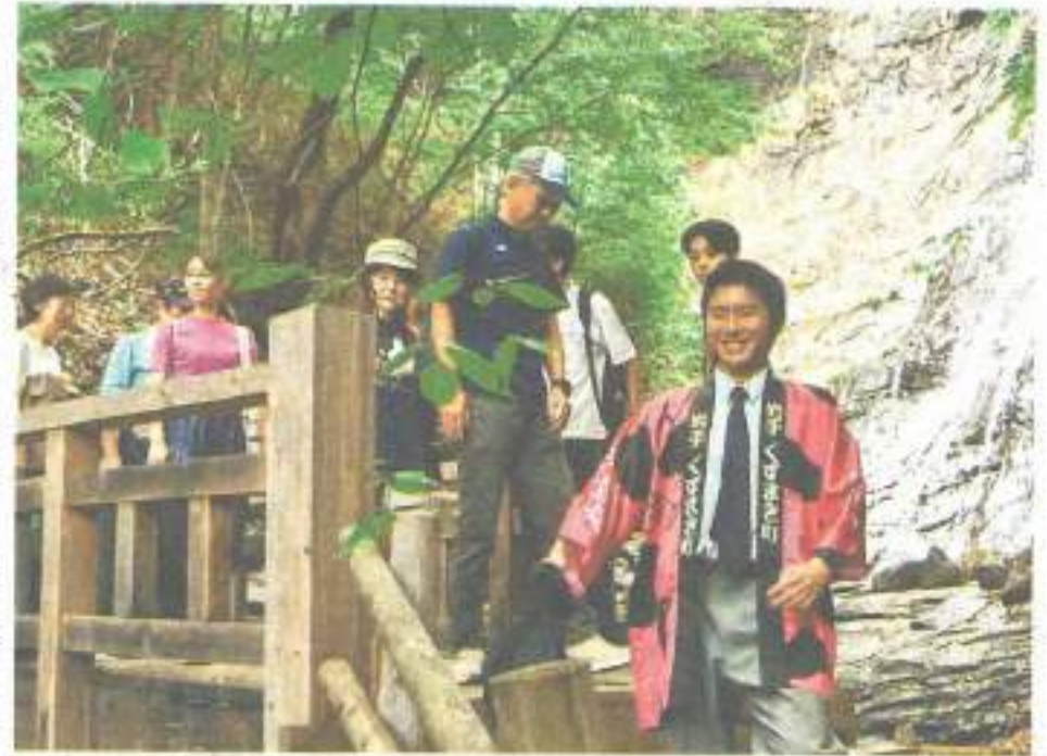
葛巻高の生徒たちの案内で 「七滝」を見学する参加者