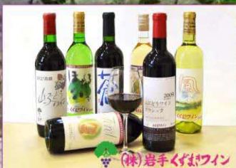
(株)岩手くずまきワイン