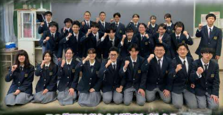
この企画は私たちが提案しました!!

葛巻町ならではの食や体験を盛り込んだモニターツアーの実施により消費者ニーズを調査するとともに、夏期間における誘客を促進し、関係人口の創出及び交流人口の拡大を図ることを目的とします。