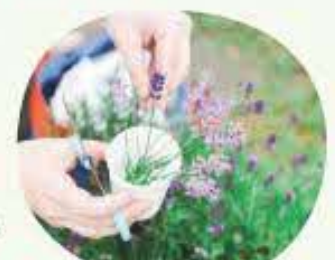
(企画協力) 岩手県蕎麦町いっしょに蕎麦づくり隊 (旅行企画・実施) トラベル・リンク株式会社