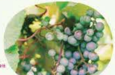
【企画協力】岩手県葛巻町いっしょいっしょ葛巻振興協議会(旅行企画・実施)トラベル・リンク株式会社